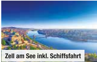
Zell am See inkl. Schiffsfahrt

Bei Vorabbuchung sparen Sie € 10 p.P. € 59 p.P.