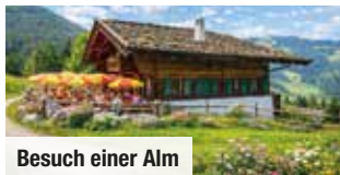
Besuch einer Alm