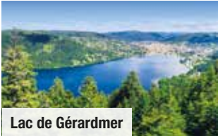
Lac de Gérardmer

1 x Abendessen als 3-Gänge-Menü im Hotel, 1 x Melker-Essen auf einem bewirtschafteten Bauernhof oder im Höhenrestaurant u. 1 x 3-Gänge-Menü im Restaurant des Freilichtmuseums Nur Vorabbuchung € 95 p. P.