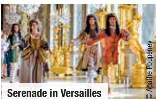
Serenade in Versailles

Paris: Hier duftet es nach köstlichen Backwaren, hier ragt der Eiffelturm in den blauen Himmel und hier herrscht der Glanz längst (noch nicht) vergangener Zeiten! Die Seine ist ein Sehnsuchtsort Romantikliebender und in Montmartre fühlen auch Sie sich wie ein junger Pablo Picasso. Höhepunkt ist Ihre Teilnahme an der Serenade in Versailles. Zwei Ganztagesausflüge und die Halbpension sind bereits inkludiert. Verlieben Sie sich in Paris!